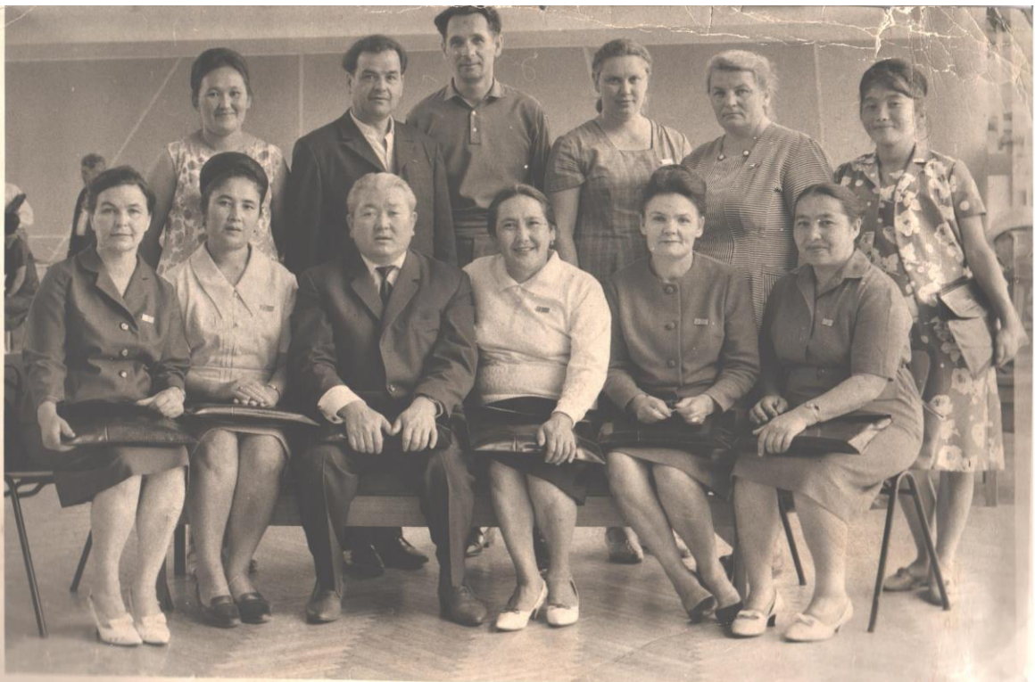
Делегату Всесоюзного съезда учителей