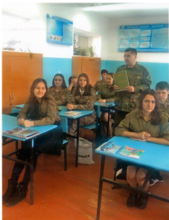
Ерлік сабағын жүргізуші: