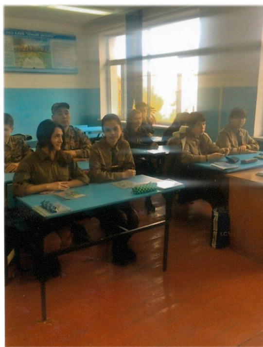
Ерлік сабанан көрініс.