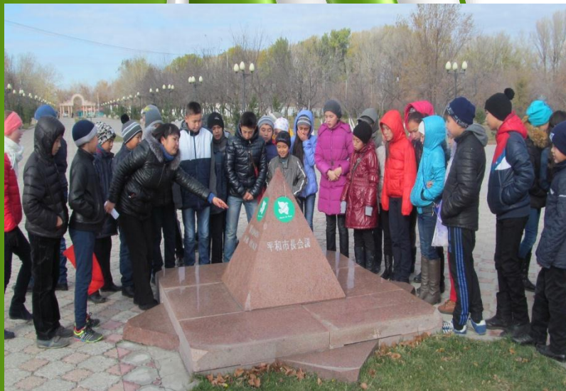
Экскурсия к монументу «Сильнее смерти» как элемент патриотического воспитания подрастающего поколения