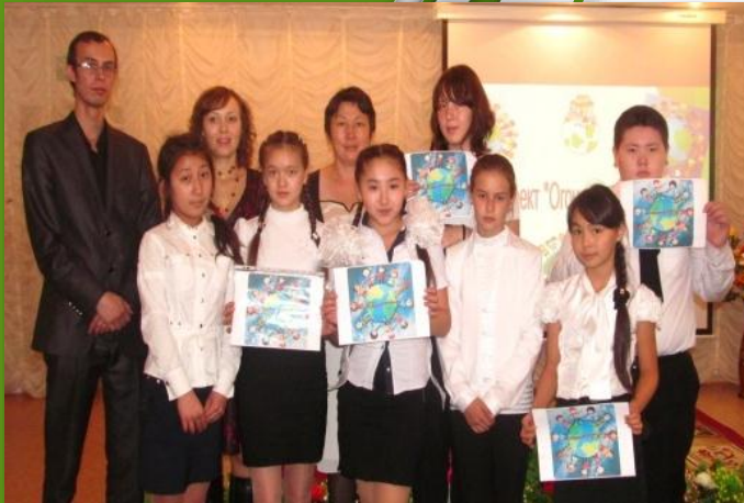
Проект «Навстречу друг другу» - встреча кружковцев биологического центра и СОШ