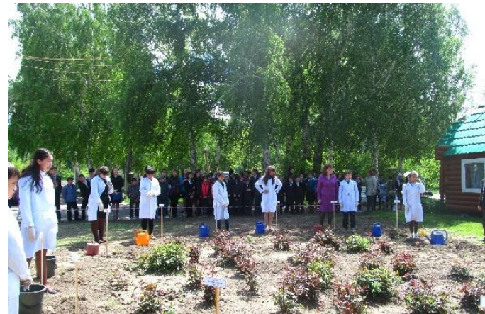
Природоохранная акция «Доро для себя, для людей, для природы»