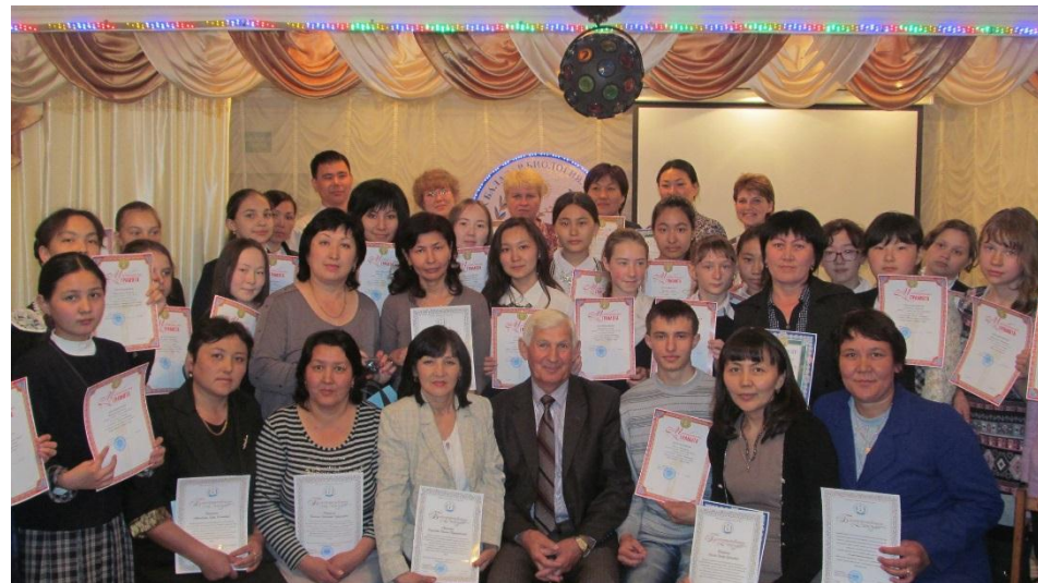
Итоговое мероприятие «Человек. Общество. Природа»