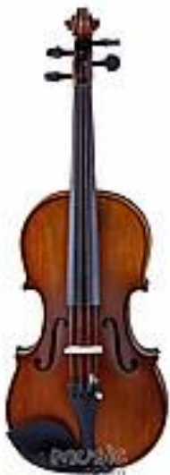
Скрипка Sonata 4/4 JYVL - E800 Ель цельная