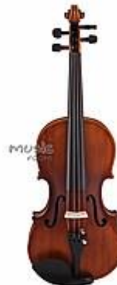
Скрипка Sonata 4/4 JYVL - E 900