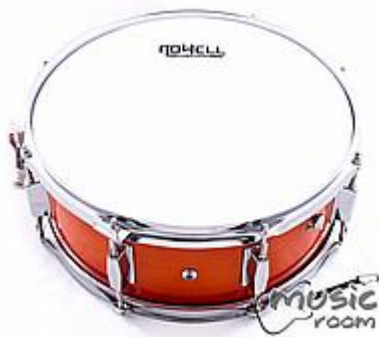
Маршевый барабан Rowell