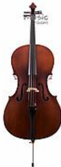
Виолончель 4/4 Sonata LYCE - E900