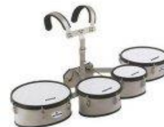
Набор маршевых барабанов с креплением 8+10+12+13