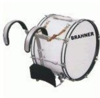
Маршевый бас-барабан, белый