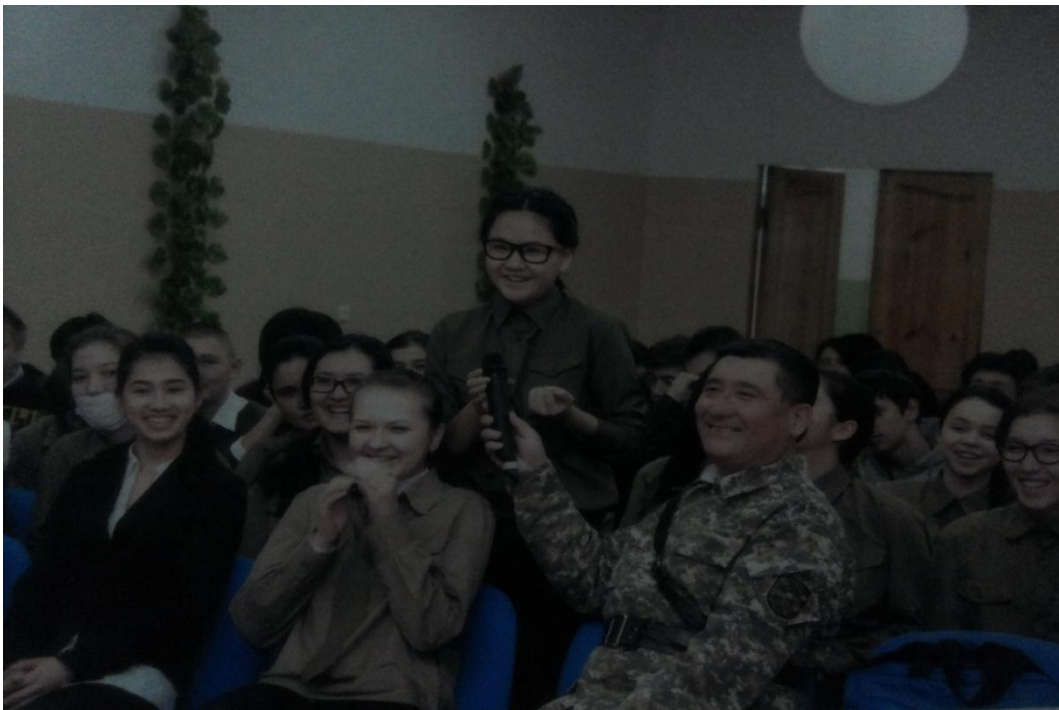
Сұрақ – жауап, пікірталас сайысынан көрініс