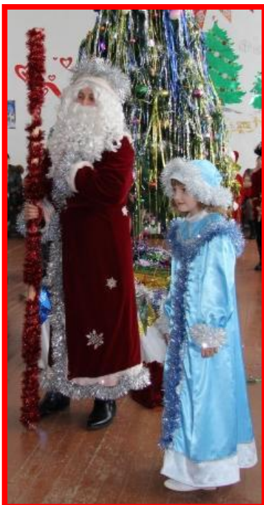
Дед Мороз и Снегурочка