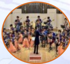
Ансамбли народных инструментов