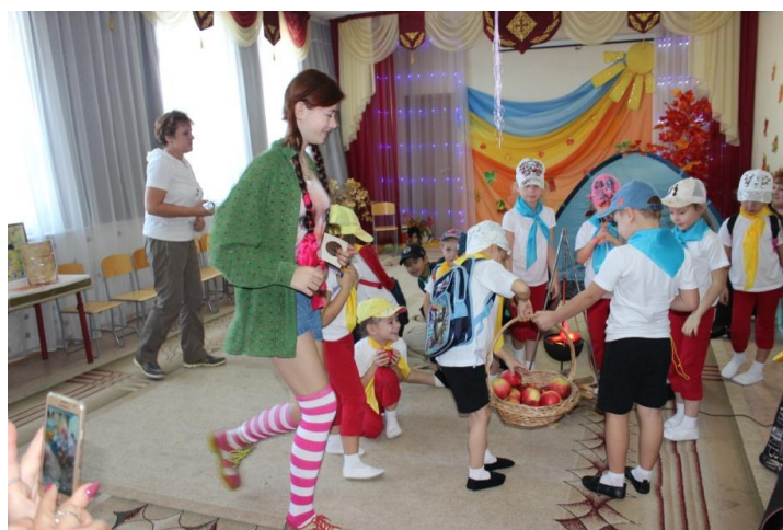
Ура, найден сладкий приз!