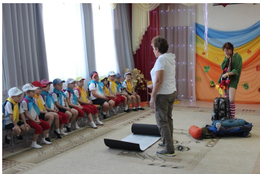
Юные туристы рассказывают о туристском снаряжении