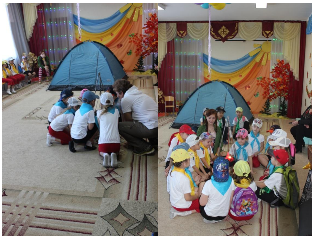
Разжигание туристского костра