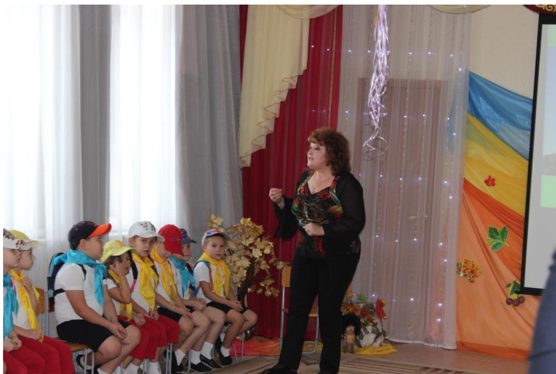
Экскурсия по Астане завершена, юные путешественники отправляются в туристский поход в окрестности города