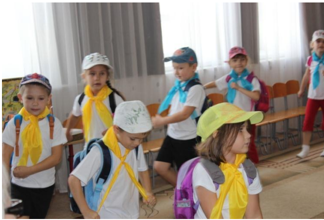
Отправляемся в туристский поход