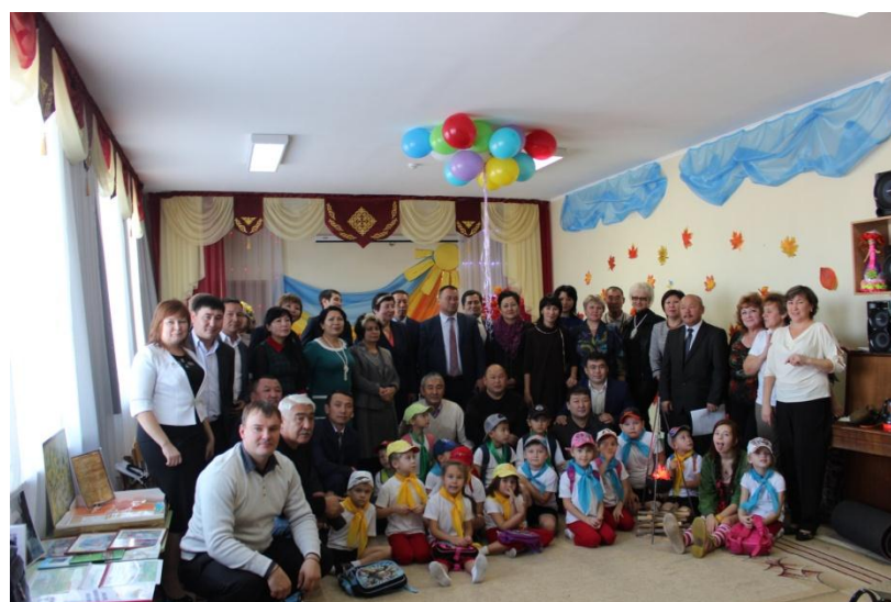
Вот и окончен наш турпоход! (фото с гостями)