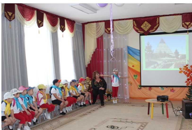
Игра «Угадай достопримечательность столицы» (собираем пазлы)