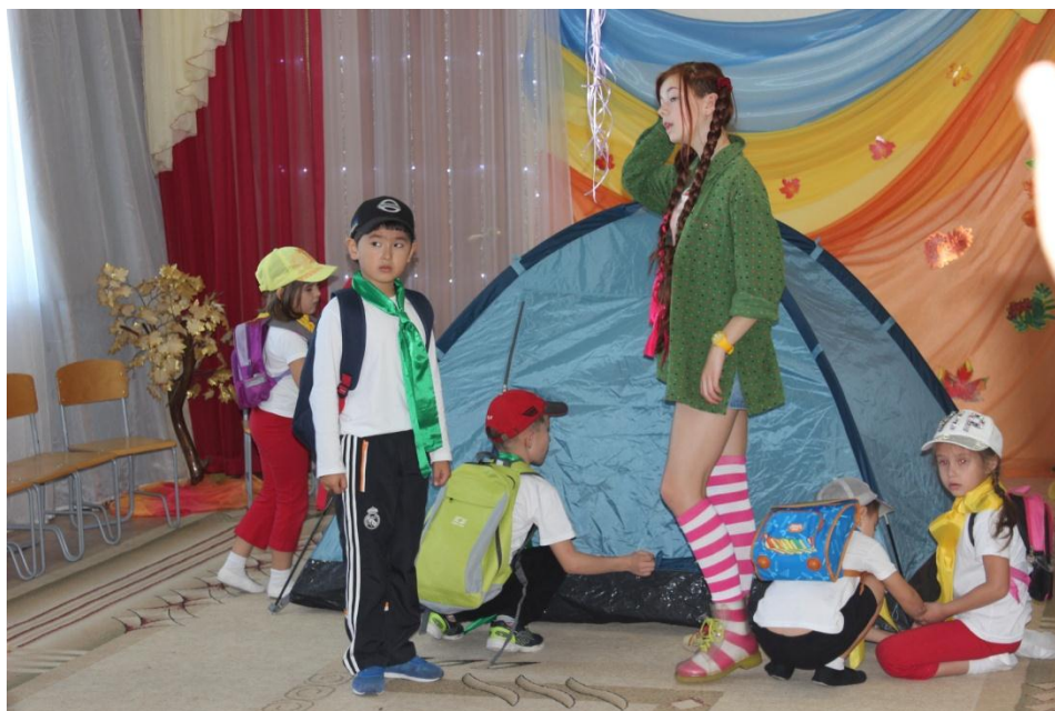
Установка туристской палатки