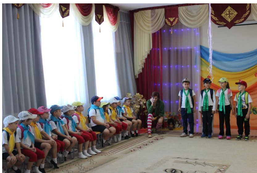
На поляне появились бывалые туристы из 2 «б» класса