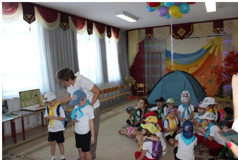
Командиры отрядов работают с компасом (найди сюрприз)