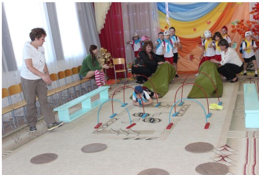
Преодоление туристской полосы препятствий (пещера)