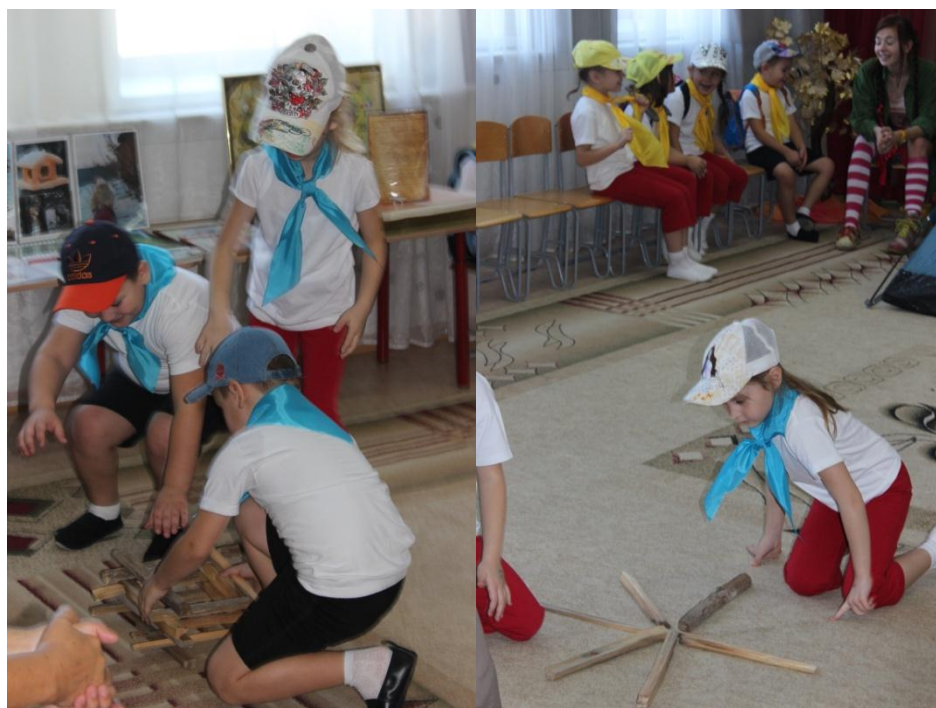
Юные туристы демонстрируют различные типы костров