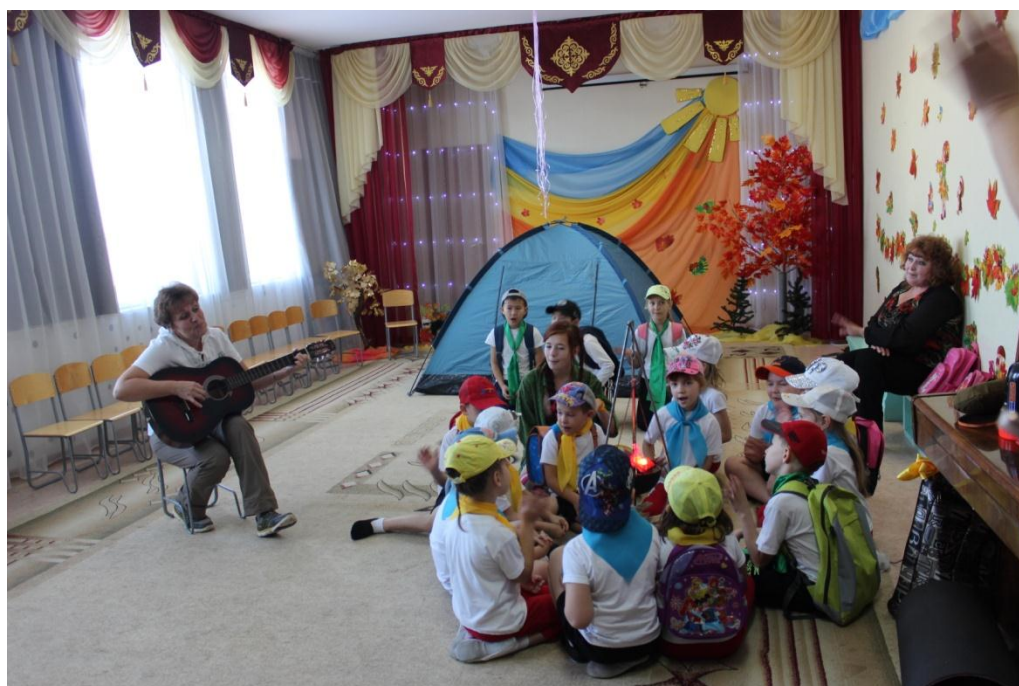
Все участники исполняют песню «Неклюжий медвежонок»