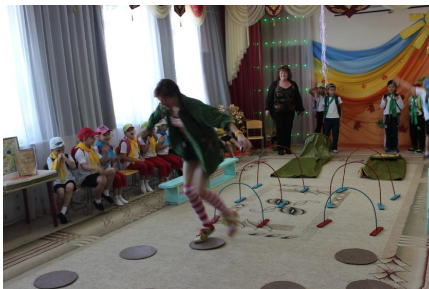
Пепши преодолевает этап «Кочки»