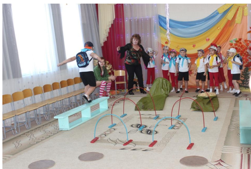
Преодоление туристской полосы препятствий (бревно)