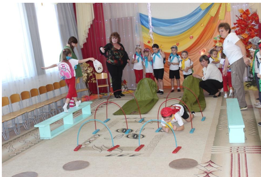
Преодоление туристской полосы препятствий (подлаз)