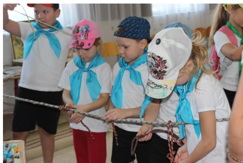
Юные туристы завязывают туристские узлы